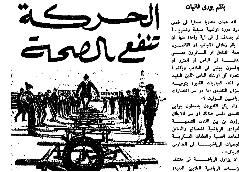
الفرق فوق رحلات متقاربة جدا واولها تصفح متر .. من الجوانب الشعبية هند الفايوتيين الذين يستكون في اواسط سيبيريا